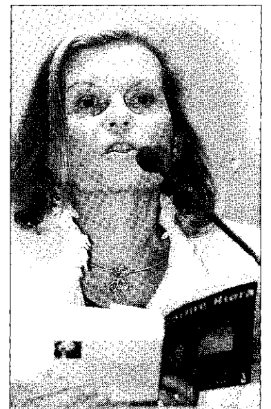
Carme Riera, ayer en la feria de Frankfurt.

La escritora mallorquina Carme Riera será esta tarde la invitada por la Associació de Dones Empresàries i Emprendedores de Tarragona para ofrecer una conferencia en la Cambra de Comerç de Tarragona a partir de las siete y media. Riera impartirá la conferencia Trencant el sostre de vidre , en la cual ofrecerá su particular impresión sobre las dificultades que tienen las mujeres para alcanzar puestos de dirección en las empresas y en las instituciones. Tras la conferencia de Riera, los asistentes al acto (abierto a todo el mundo) tendrán la oportunidad de establecer un pequeño diálogo con esta importante escritora.