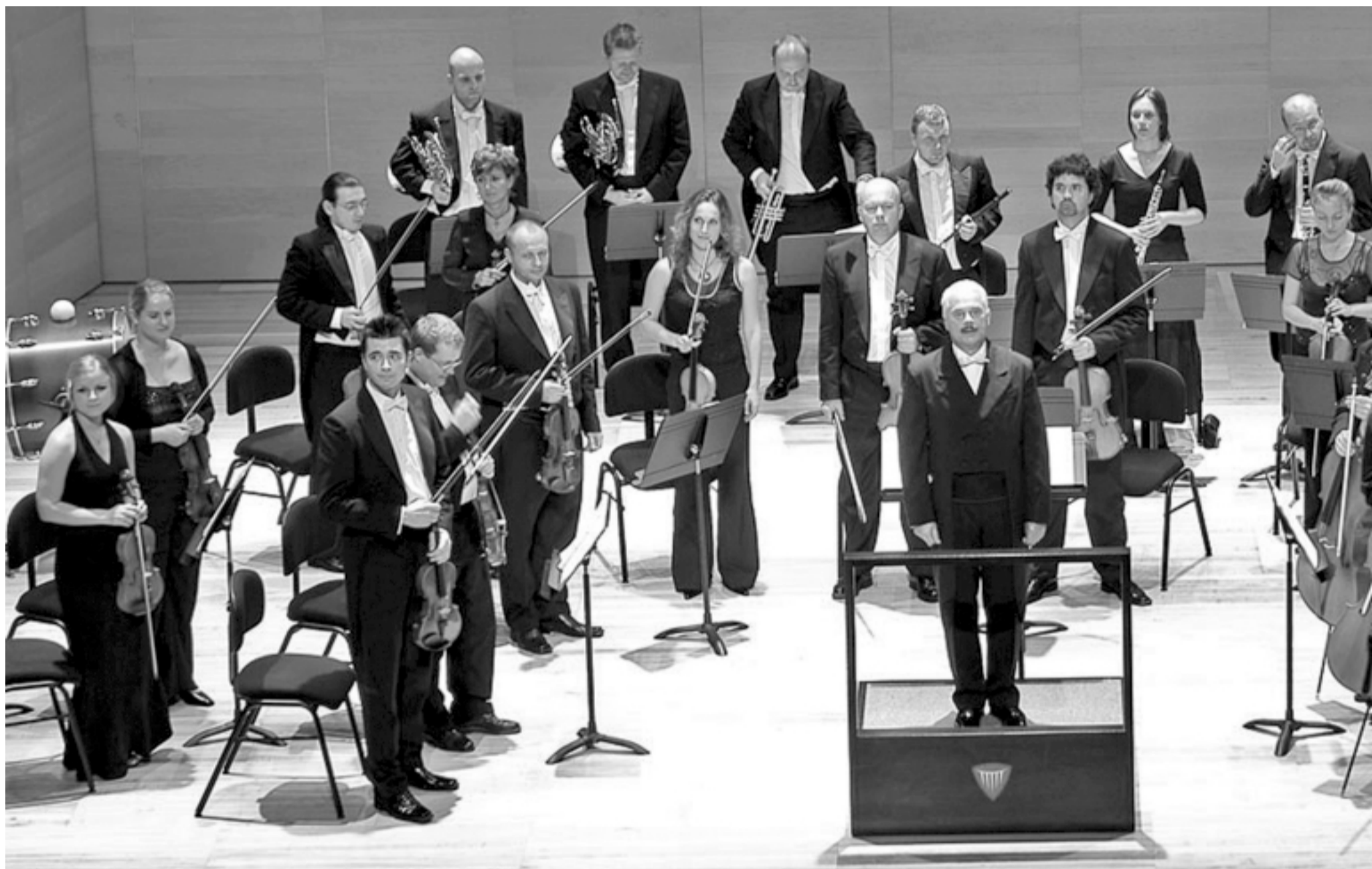
La Orquesta Internacional de Praga saluda al público tras uno de los conciertos ofrecidos en Logroño. S.E.